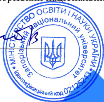
Микола ФРОЛОВ Ректор

в рамках міжнародного проекту Erasmus+ 620386-EPP-1-2020-1-UA-EPPJMO-MODULE "ПОЛІТИКА ПАМ'ЯТІ: ЄВРОПЕЙСЬКИЙ ДОСВІД ДЛЯ ПРИМИРЕННЯ В УКРАЇНІ" (м. Запоріжжя, Запорізький національний університет, 31 травня 2022 року)