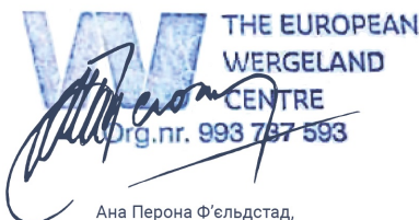
Ана Перона Ф'ельдстад, виконавча директорка Європейського центру Вергеланда